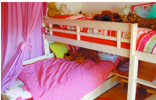
Hebben kinderen veel onderling ruzie, plaats dan de bedden met het hoofdeind naar dezelfde richting.

En welk advies heeft Nicky voor de kinderkamer van Sabien en Sofie? We nemen een kijkje. In de gezellige meidenkamer - veel licht en veel roze - staat een soort stapelbed met