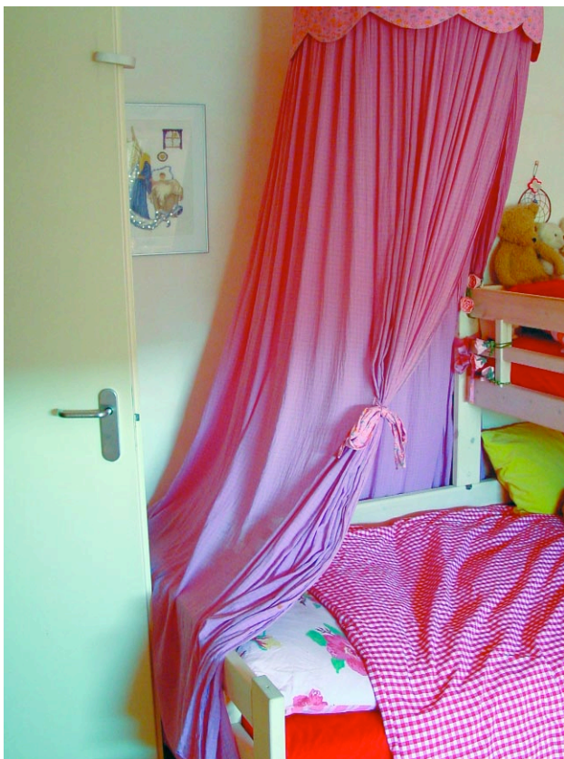
Hoofdeinde bij deur is niet optimaal, de 'klamboe' is een goede oplossing.

sloop, ingesloten tussen de muur en haar man. Die omhulling moet ze proberen los te laten. Daarom heb ik haar geadviseerd het bed zo te verschuiven dat aan beide zijden loopruimte ontstaat. Zo creëert ze ruimte voor zichzelf en tegelijkertijd ontstaat er meer gelijkwaardigheid tussen haar en haar partner.”