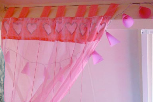
Een mooie oplossing voor het 'verzachten' van een plafondbalk.