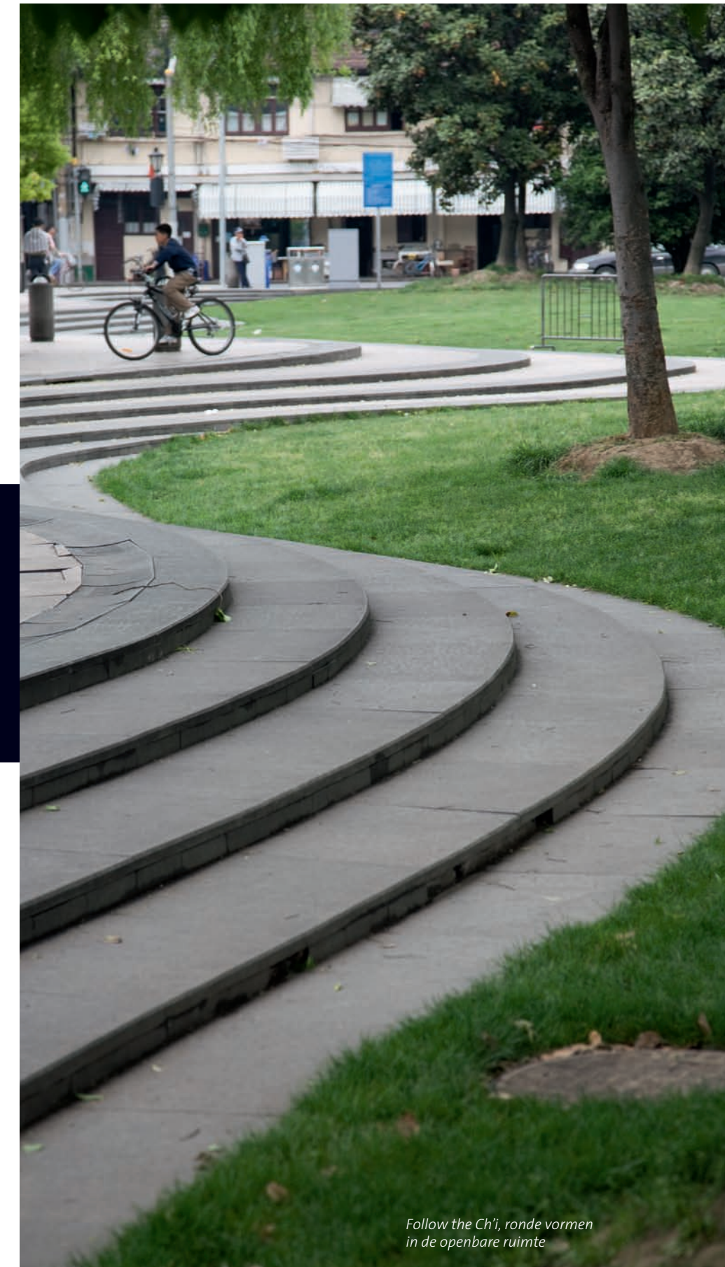
Follow the Ch'i, ronde vormen in de openbare ruimte