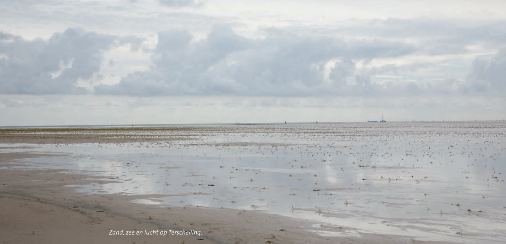
Zand, zee en lucht op Terschelling.