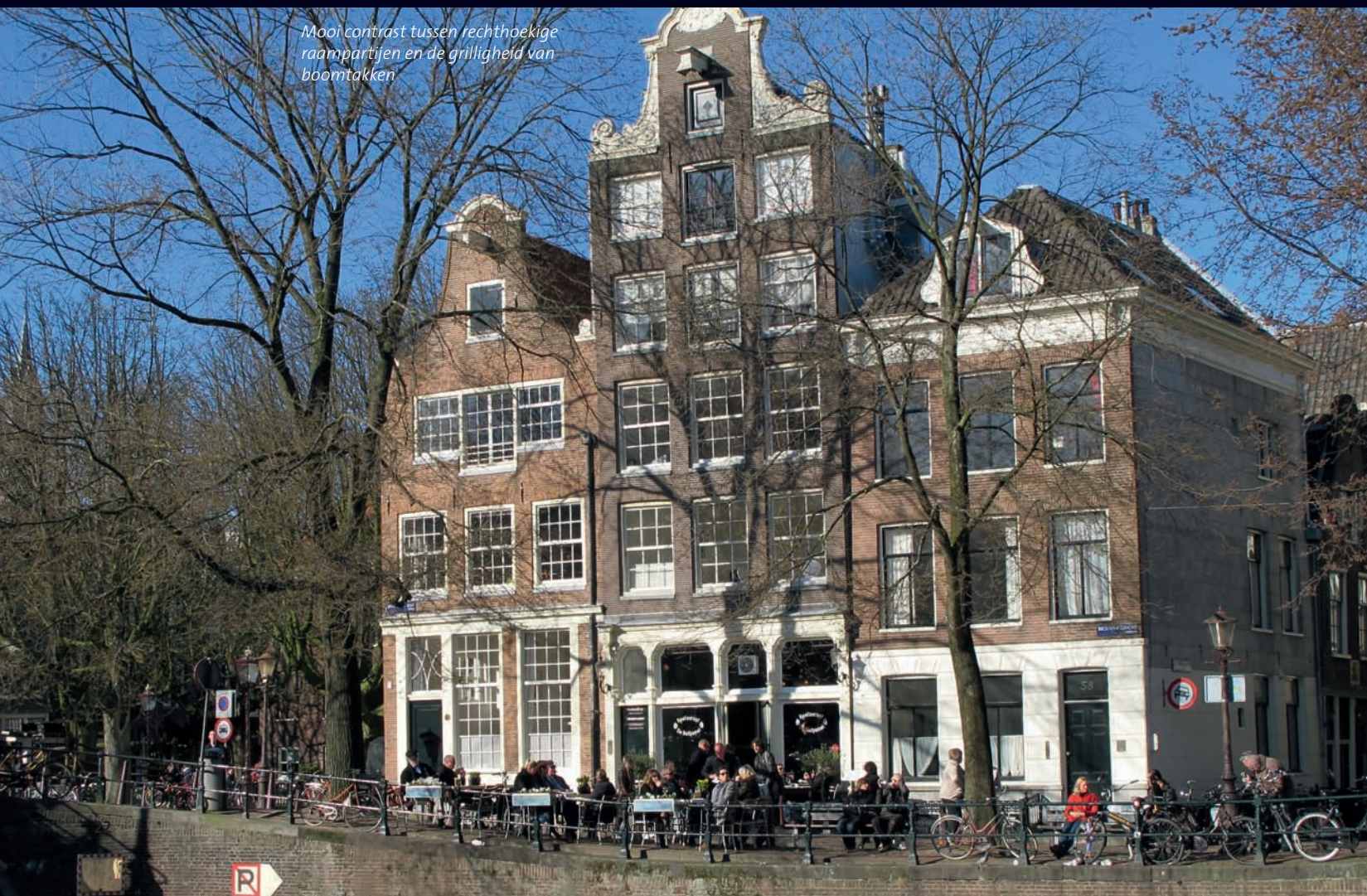
Mooi contrast tussen rechthoekige raampartijen en de grilligheid van boomtakken