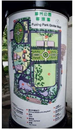
▲ Plattegrondindeling Fuxing park, Shanghai